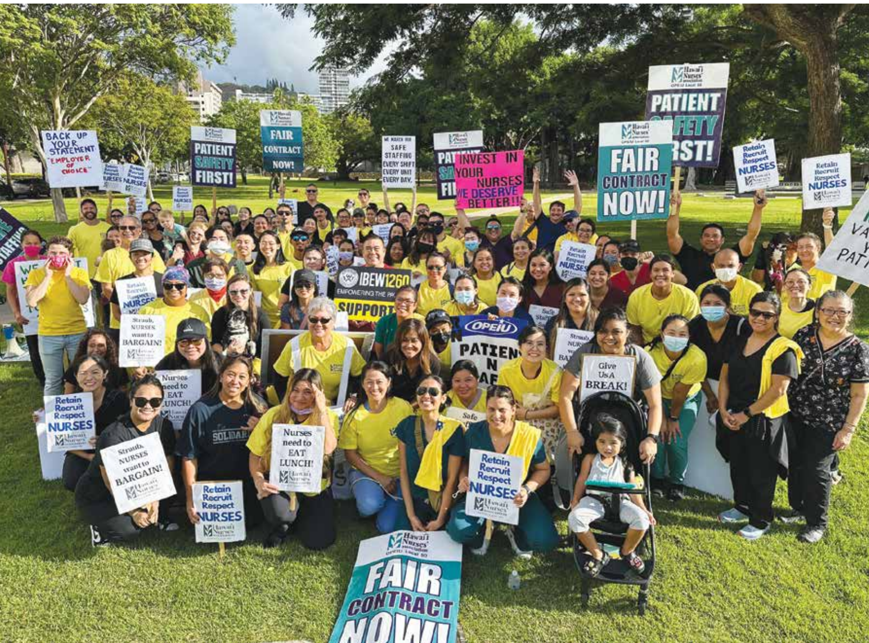
Las enfermeras registradas de la Asociación de Enfermeras de Hawái (HNA)/OPEIU Local 50 en el Centro Médico Straub realizan un piquete informativo mientras hacen campaña por un contrato justo.