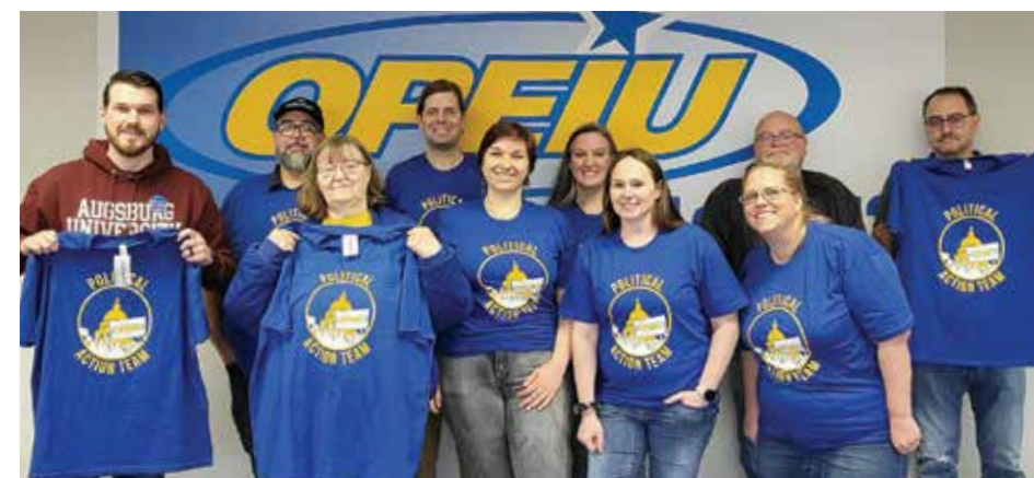
Los miembros del equipo de acción política de la Local 12 coordinan centros de llamadas, y van de puerta en puerta en sus comunidades en Minnesota para ayudar a elegir candidatos favorables a los trabajadores durante las elecciones intermedias de noviembre.

Los investigadores estimaron que un grupo de nueve estados en disputa mostró una participación de los jóvenes de alrededor del 31 por ciento, lo que marca una gran diferencia en cuanto a mantener una mayoría en favor de los trabajadores en el Senado. La inflación, el derecho al aborto, los salarios dignos y el cambio climático fueron cuatro de los principales temas identificados por los investigadores como los que marcaron la diferencia para comprender los patrones de votación de los jóvenes. La investigación proporciona información importante a tomar en consideración, acerca de la participación electoral a medida que se acercan las elecciones presidenciales de 2024.