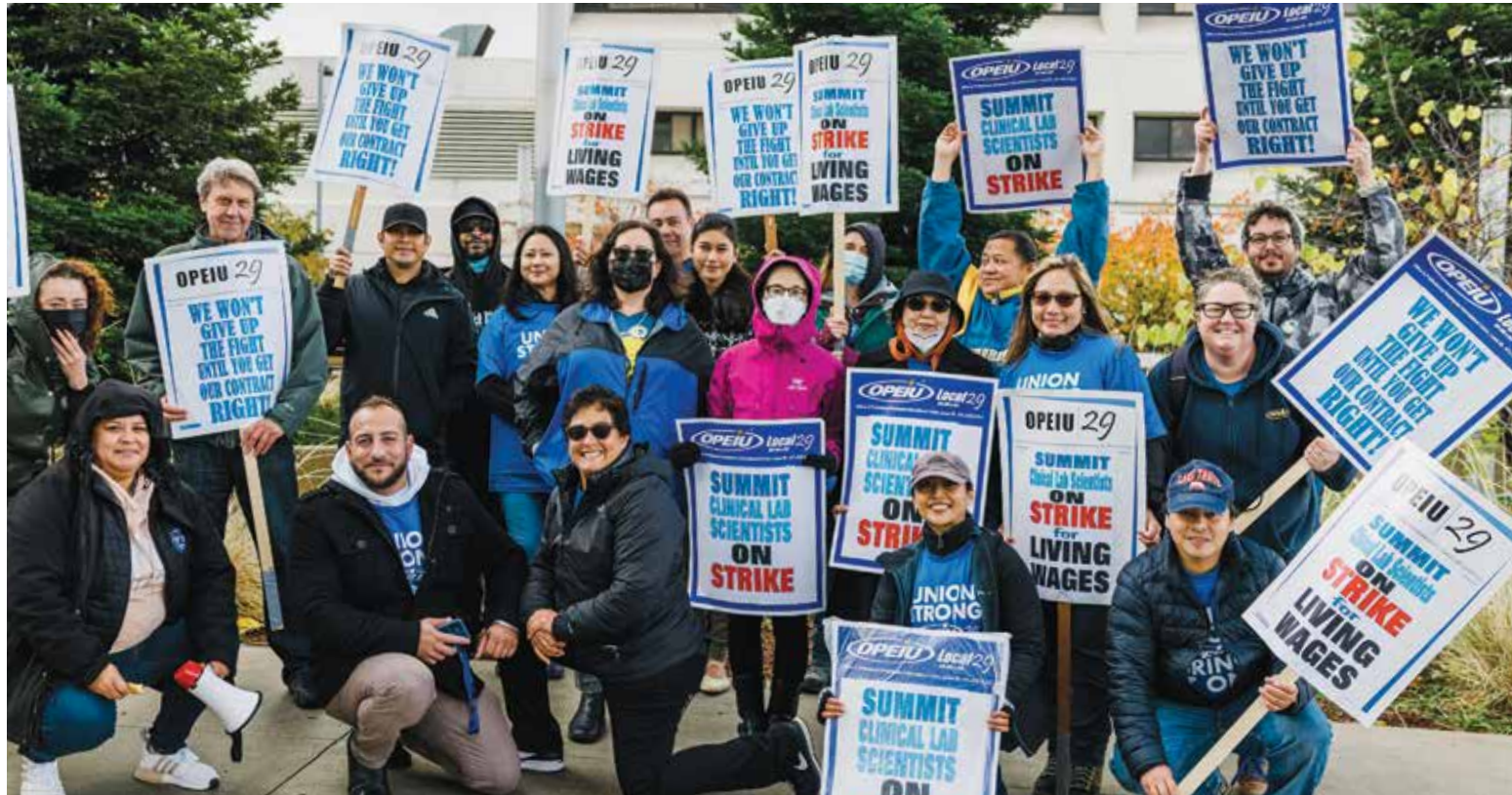
Los científicos del laboratorio clínico, representados por la Local 29, fueron a la huelga en diciembre demandando salarios justos.