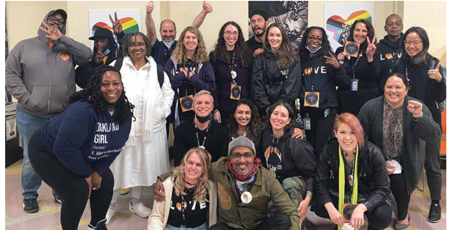
Glide United celebra su unión recién formada con la Local 29.

Maestros, administradores de casos, oficinistas, trabajadores de servicios alimentarios y personal de reducción de daños de la Fundación Glide, una organización sin fines de lucro con sede en San Francisco, lograron el reconocimiento de su sindicato, Glide United, en una votación aplastante en noviembre.