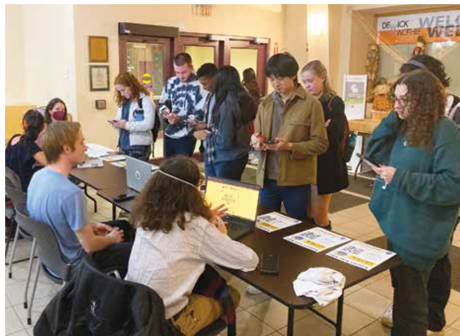
Los estudiantiles asistentes residentes de la Universidad de Tufts en Boston instalaron una mesa de información para obtener apoyo para su lucha por un sindicato. Los RA recabaron 1,340 firmas para una petición a la administración para reconocer su sindicato.

Las enfermeras anunciaron que formarían un sindicato en noviembre mediante una carta a la administración de la universidad solicitando el reconocimiento voluntario de ULTRA. La universidad rechazó su solicitud, a pesar de que el 85 por ciento de las enfermeras, 123 de 142, habían firmado tarjetas de autorización sindical. Posteriormente ULTRA presentó una solicitud para elección con la Junta Nacional de Relaciones Laborales.