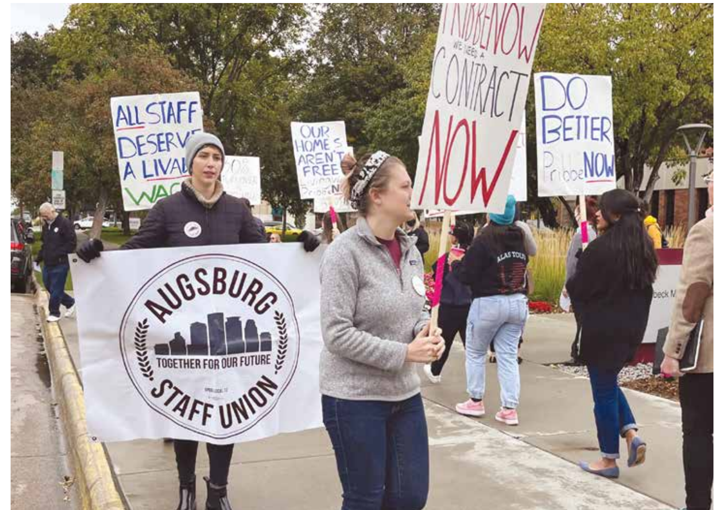
Mitin del personal de Augsburg por un contrato justo afuera de una reunión del Consejo de Regentes de la Universidad. Más tarde, ese día, se logró la firma de un contrato.