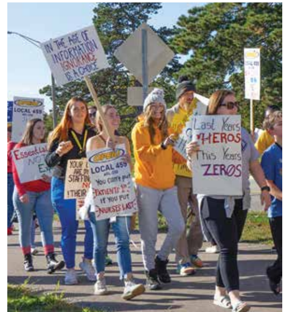
Las enfermeras registradas de la Local 459 en McLaren Greater Lansing realizan un piquete informativo.