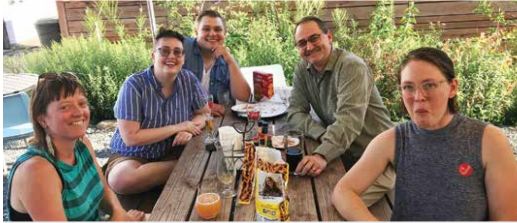
Los miembros del equipo negociador de Land Stewardship Project (LSP) celebran su primer contrato con los representantes de la Local 12. El personal de LSP, una organización agrícola sin fines de lucro enfocada en ayudar a granjas pequeñas y medianas, es solo uno de los muchos grupos de trabajadores de organizaciones sin fines de lucro que han formado un sindicato con Nonprofit Employees United de OPEIU en los últimos años.

► Consulte la página a continuación para obtener más información sobre cómo los empleados de organizaciones sin fines de lucro recurren a uniones como OPEIU.