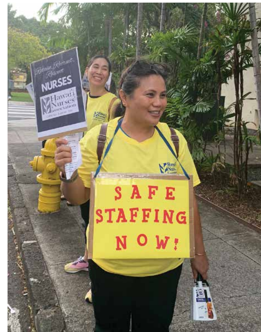
Las enfermeras registradas de Straub lucharon y ganaron aumentos salariales generales después de trabajar sin contrato desde noviembre. Las enfermeras siguen preocupadas por los niveles seguros requeridos de personal para garantizar la seguridad del paciente.